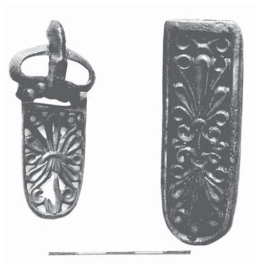
Рис. 1. Поясная пряжка с подвижным щитком и наконечник пояса из катакомбы № 59 Даргавского могильника.