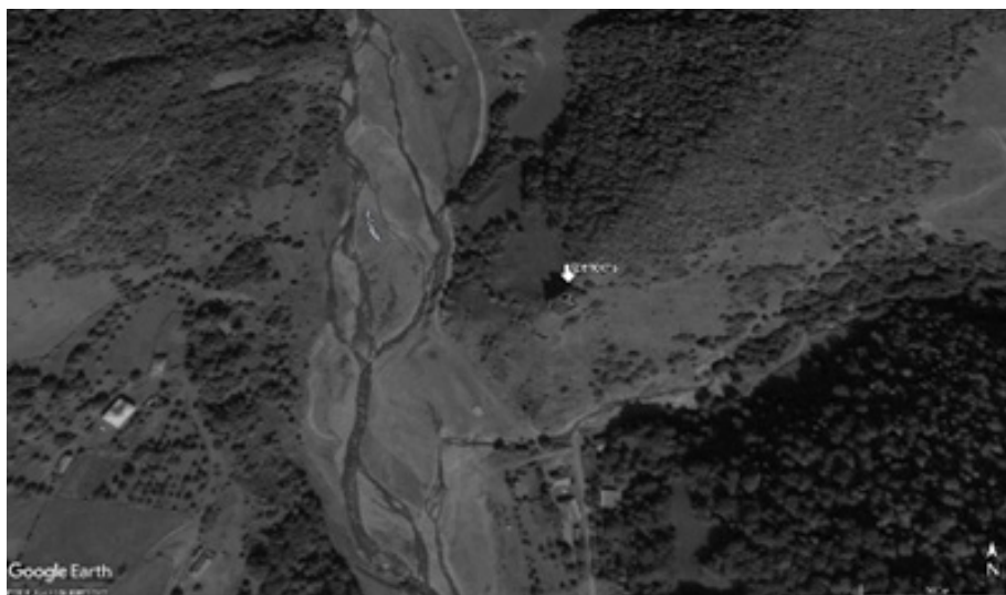
Рис. 1. Крепостной комплекс в ущелье Карцух. Ситуативный космоснимок

обозначено ли этим топонимом вновь селение или уже локальная ущельная община, включавшая несколько селений от селения Елойта до селения Харбал. По версии С.И. Макалатиа, селение Карчохи находилось на месте современного селения Паулиатае [5, 110]. Осетинским вариантом топонима является Карчох , в современном чысанском говоре осетинского языка – Карцух [6, 36–38]. Последняя форма имеет ряд параллелей в осетинской и грузинской топонимике, и обе формы могут быть соотносены с абхазской фамильной антропонимикой [7, 233, 263].