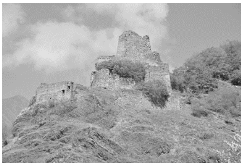
Рис. 2. Крепостной комплекс в ущелье Карцух. Вид с юга.