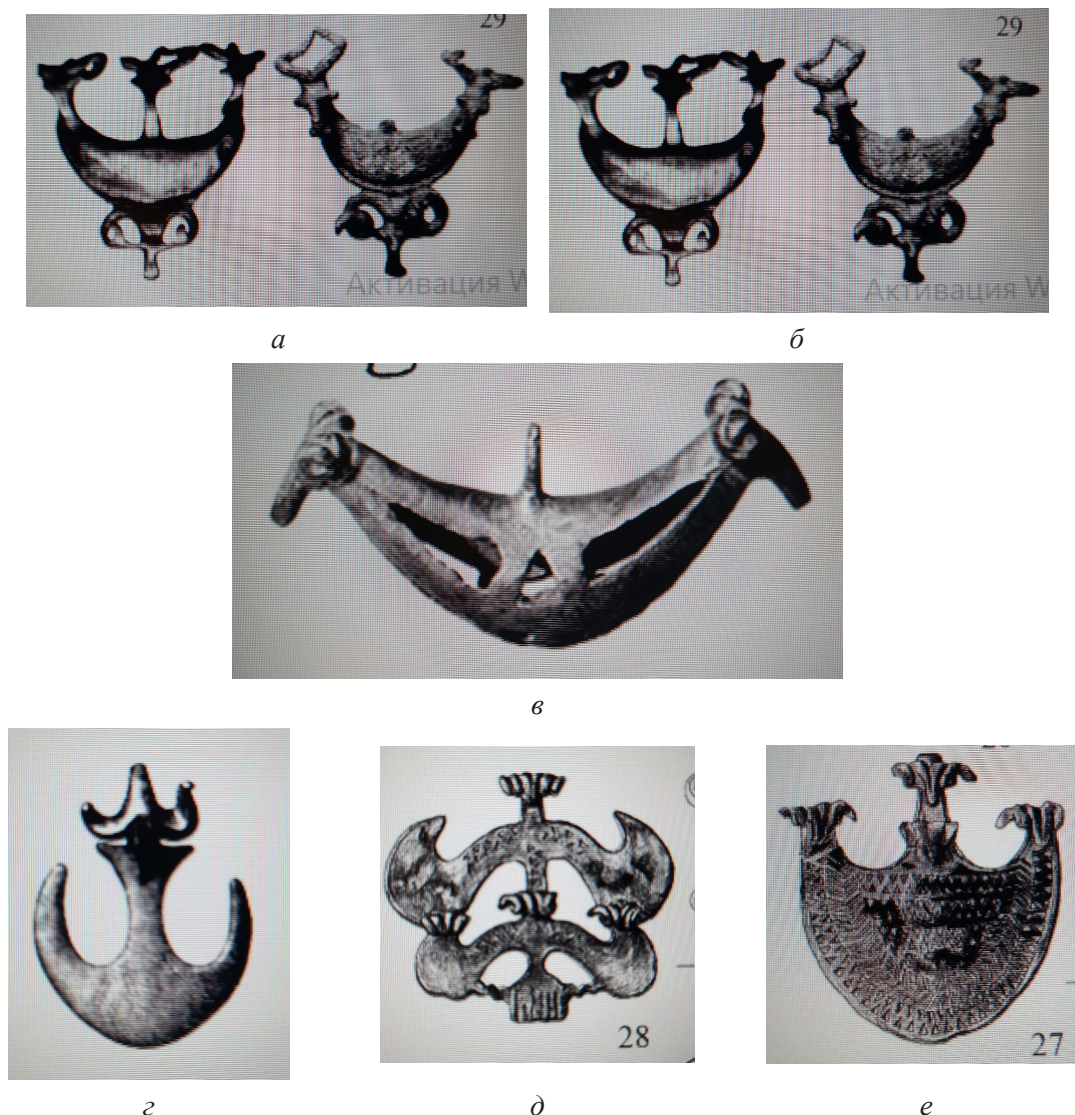
Рис. 3. Амулеты из Кобанских погребений.

В нартовском эпосе рога символизируют сакральную силу. Они часто связаны с божеством охоты Афсати , являются атрибутом золотой свирели Ацамаза. Как лунарный символ, рога способствуют воскрешению зверей и выступают в качестве связующего звена между миром нартов и загробным миром. В то же время витые бараньи рога символизируют благодать – фарн – и связаны с Фæлвæра . Мифологема « Фæлвæра » может быть связана с христианством [22].