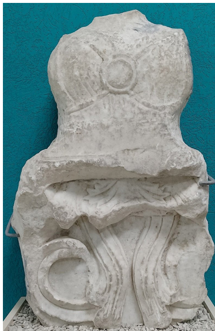
Рис. 2. Статуя «прорастающей девы» – разновидность изображения Змееной богини. Восточно-Крымский историко-культурный музей-заповедник.

Крыму и на Таманском полуострове, изображения женских божеств земли, туловище которых вырастает из растительных побегов или заканчивается несколькими парами голов змей или грифонов, иногда крылатых (рис. 2). В этих образах переплелись древние иранские и греческие представления» [8].